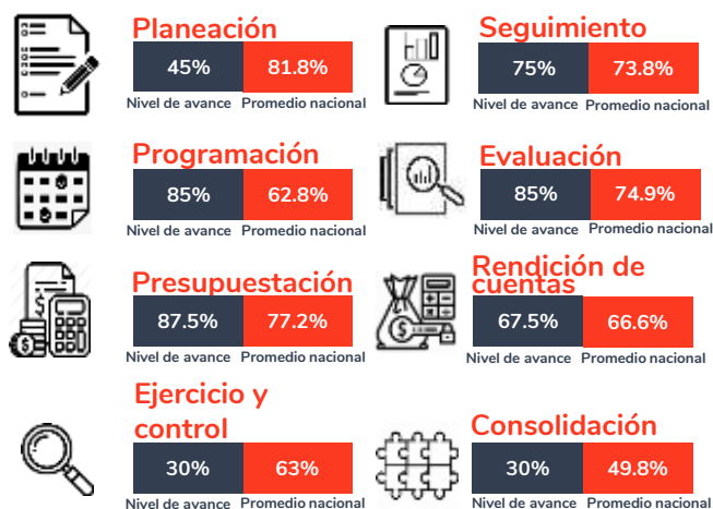
Tabla 1. Resultados del diagnóstico por sección en el estado de San Tlaxcala, 2020