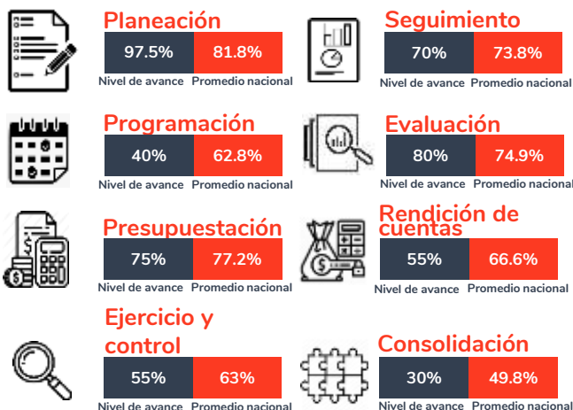
Tabla 1. Resultados del diagnóstico por sección en el estado de Tabasco, 2020