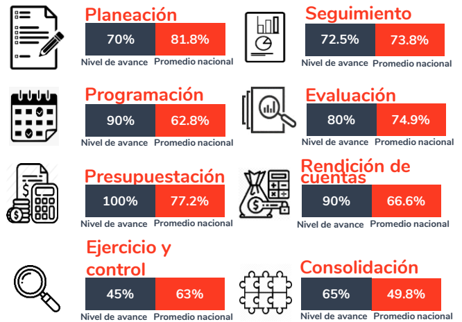
Tabla 1. Resultados del diagnóstico por sección en el Estado de Nayarit, 2020