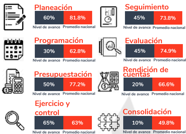
Tabla 1. Resultados del diagnóstico por sección en el estado de Aguascalientes, 2020