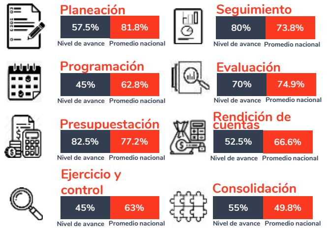
Tabla 1. Resultados del diagnóstico por sección en el estado de San Tamaulipas, 2020