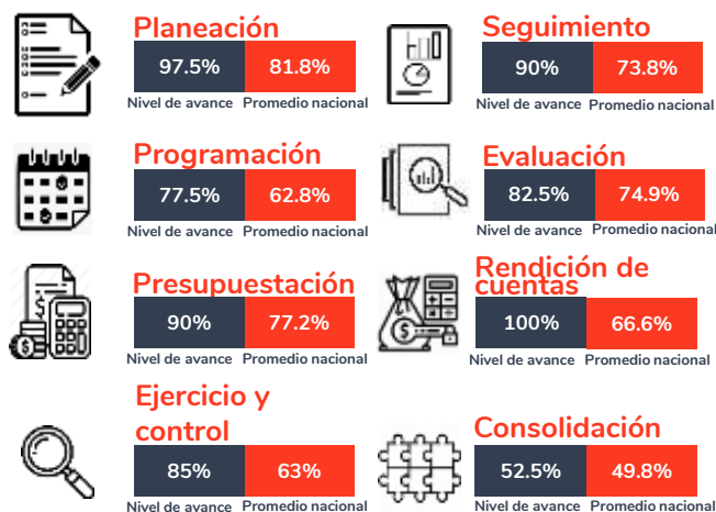
Tabla 1. Resultados del diagnóstico por sección en el estado de Sonora, 2020

Los resultados por secciones se expresan en la siguiente tabla para el año 2020.