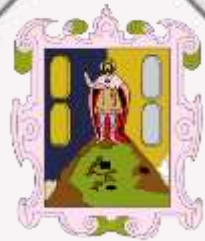
San Luis Potosí