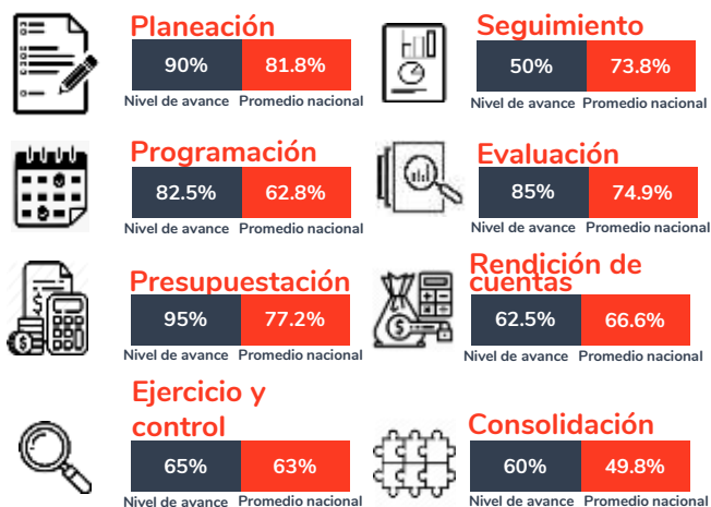
Tabla 1. Resultados del diagnóstico por sección en el estado de Quintana Roo, 2020