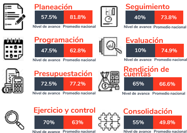
Tabla 1. Resultados del diagnóstico por sección en el estado de Baja California Sur, 2020.